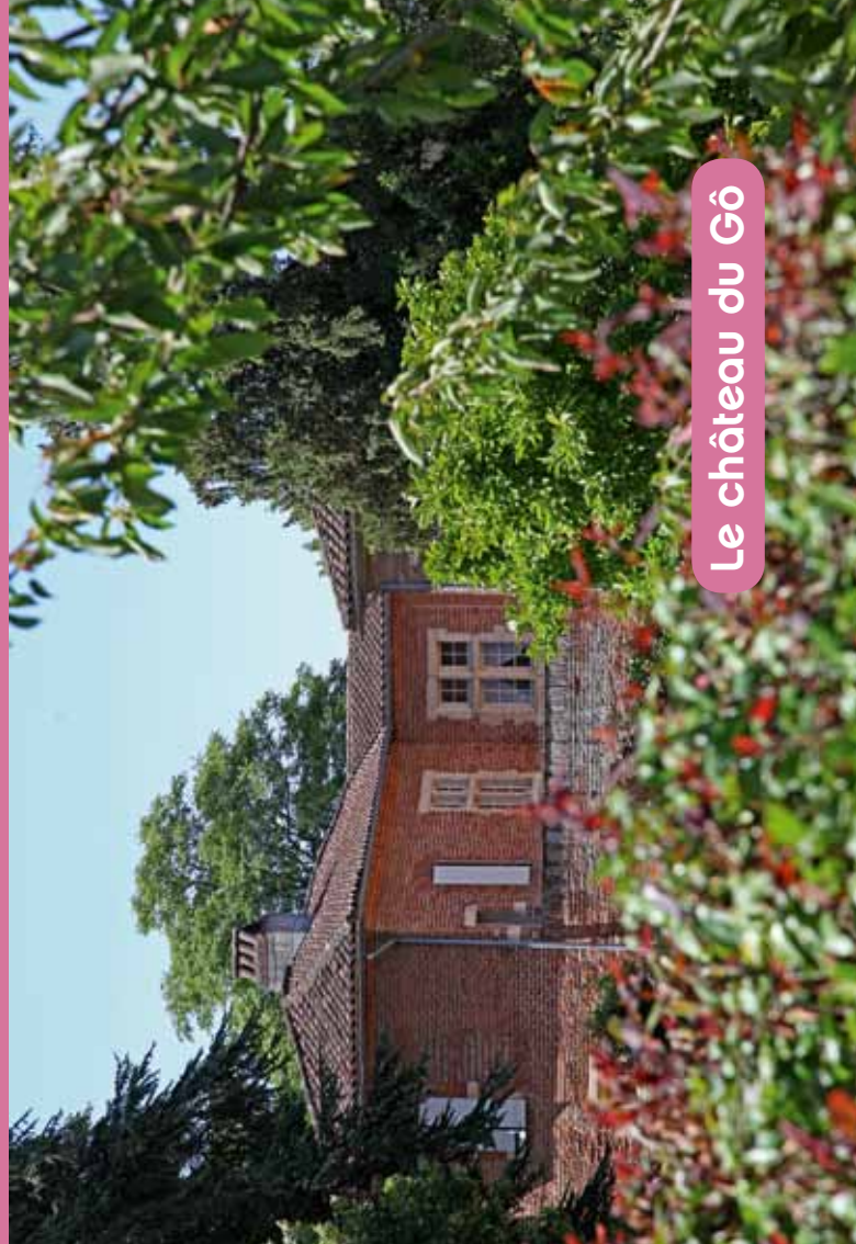
Le château du Gô

Élégant petit manoir bâti à la fin de la Renaissance, le château du Gô est composé de trois corps de bâtiments (en U) qui encadrent une petite cour intérieure, fermée sur le quatrième coté par un mur bas percé d'une porte cochère. L'originalité vient du plan qui s'apparente plus à celui d'un hôtel particulier urbain qu'à celui d'une demeure ouverte sur la campagne. Malgré l'unité de style, il semblerait que certaines parties aient été reprises au XVII e siècle. Au nord du château, le séchoir à tabac , bâtiment à pans de bois, rappelle l'implantation de cette culture dans le Tarn. Enfin, ce château a aussi été le lieu de naissance en 1741 du célèbre navigateur Jean-François Galoup de Lapérouse qui y passa son enfance.