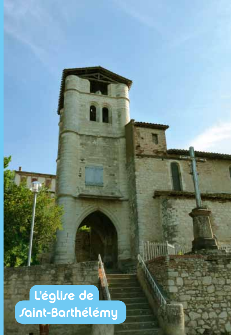
L'église de Saint-Barthélémy

L'église de Castelnaud-de-Lévis est située au niveau des remparts de la ville. Son clocher a un caractère défensif: il servait de tour de guet et de porte qui constituait vraisemblablement l'entrée du village. Ce clocher porche est typique des églises de la région albigeoise.