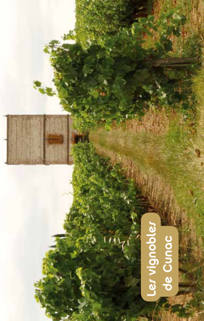
Les vignobles de Cunac

Le vin de Cunac est le plus ancien des vins rouges du Tarn. La viticulture tarnaise a été implantée par les Romains mais son développement commence au X e siècle sous l'influence des bénédictins de Gaillac. Le « noyau » de Cunac est rattaché de longue date au vignoble gaillacois. Son extension remonterait au XII e siècle, à l'époque des Templiers, alors présents au lieu-dit Lanel. À cette époque, les « clarets » de Cunac étaient expédiés, via le Tarn et la Garonne, vers le Nord de la France, l'Angleterre et la Belgique. Leur renommée fut consacrée par François I er , puis par Richelieu qui, dit-on, en fit son vin de messe. Un peu plus près de nous, Lapérouse lui aurait fait faire le tour du monde. Le petit vignoble de Cunac a été intégré dans le périmètre de l'aire d'appellation AOC Gaillac. Le chai de Cunac, annexe de la Cave coopérative de Labastide-de-Lévis , recueille les vendanges cunacoises, essentiellement manuelles.